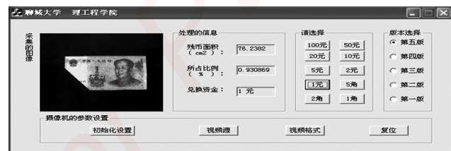
图 3 软件主界面

上接第 40 页 平面设计的高手 不仅仅需要良好的教材 熟练的老师 最重要的是自身不断的学习 不断的使用 善于思考 总结和举一反三 发现软件当中的闪光点。“实践出真知” 相信大家在不断地使用过程中 会逐步发现并掌握更好更新的操作技巧。